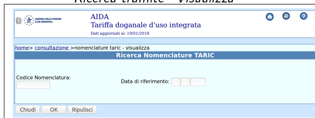
Ricerca tramite "Visualizza"

Nel campo Codice Nomenclatura è possibile inserire i primi 4 digit di un codice di Nomenclatura Combinata. Inseriamo ad esempio il codice 8703. Il portale presenterà la struttura della Nomenclatura Combinata associata a questo codice fino ai codici TARIC a 10 digit. Nella figura che segue è presentata il risultato di questa ricerca.